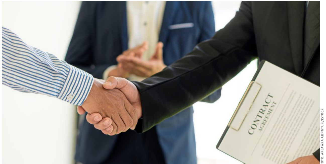
In Verbindung bleiben: Hersteller dürfen seltener in die Handelszentralen. Gute Vertriebler punkten heute über Analysen.

Gut bezahlt werden nach Hennigs Erfahrung auch Key-Accounter in großen Konzernen, die ein Team führen. Unterdurchschnittlich vergütet hingegen werden die Positionen im Bereich Handelsmarken, wenn das Geschäft